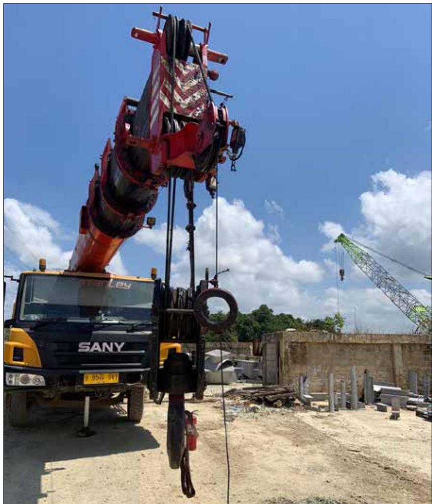
Crane yang beroperasi di bawah SUTT 150 kV Karang Joang - Kariangau yang disinyalir menjadi penyebab gangguan meluas di sistem interkoneksi Kalseltengtim.

"Pasca terjadinya gangguan, kami bergerak cepat melakukan lokalisasi dan penormalan gardu induk serta jaringan transmisi yang terganggu. Sehingga pada pukul 13:00 WITA seluruh gardu induk telah kembali bertegangan," tutur Salam dalam keterangan persnya yang diterima MediaKaltim.com pada Selasa (8/8/2023) malam.