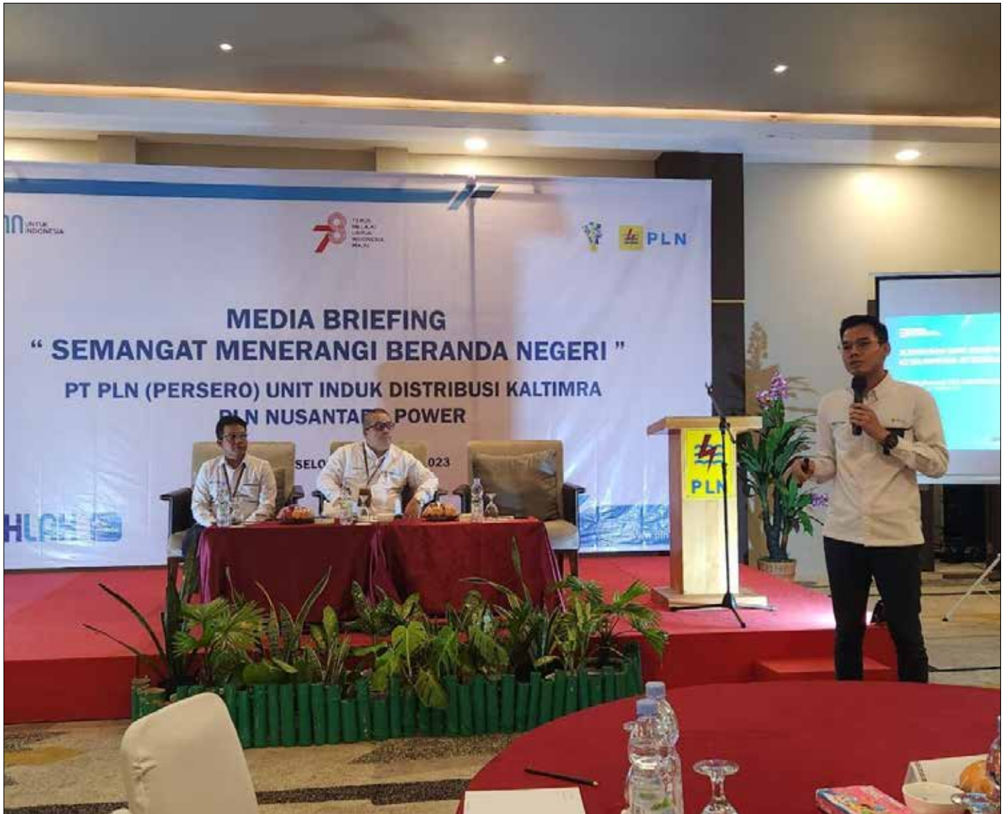
Pemaparan desa yang belum teraliri listrik oleh PLN UIW Kaltimra.