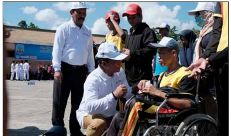
PERHELATAN O2SN: Gubernur Kaltara, Drs H Zainal A Paliwang SH, M.Hum menyambangi salah satu peserta O2SN Tingkat Provinsi Kaltara di Lapangan SMK Negeri 2 Tarakan, Selasa (8/8).

Sementara dalam penyerahan SK BLUD kepada SMK yang ada di Kaltara merupakan tonggak sejarah dalam meningkatkan mutu dan relevansi pendidikan vokasi di provinsi ini. Melalui BLUD SMK, diharapkan para peserta didik dapat mengalami pembelajaran yang lebih kontekstual dengan menghadapi tantangan dunia kerja sebenarnya. "Ini akan menjadi investasi besar untuk mencetak lulusan SMK yang siap bersaing di dunia industri," tutup Gubernur Zainal. (dkisp)