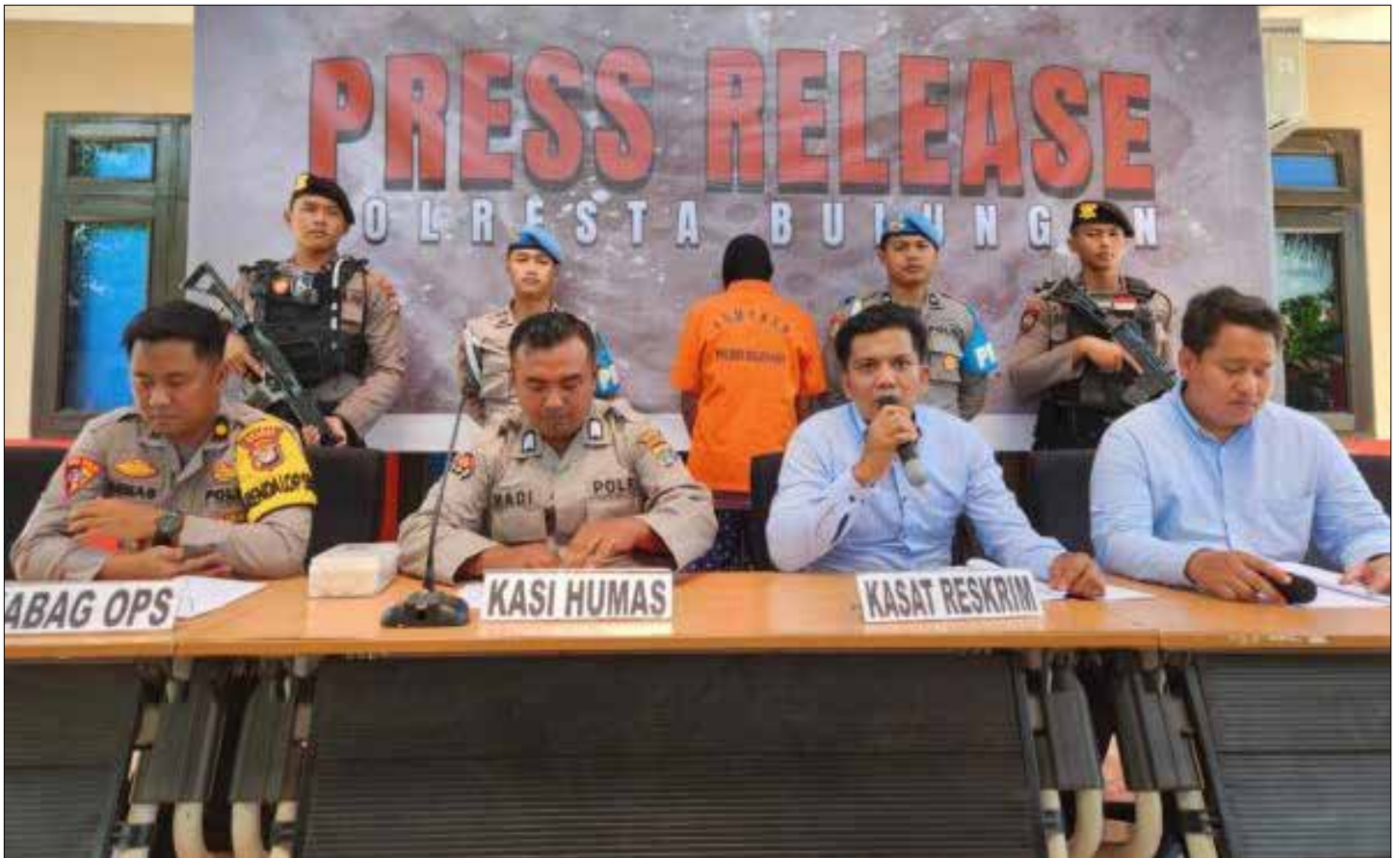
Suasana press release kebakaran lahan seluas 20 hektare.