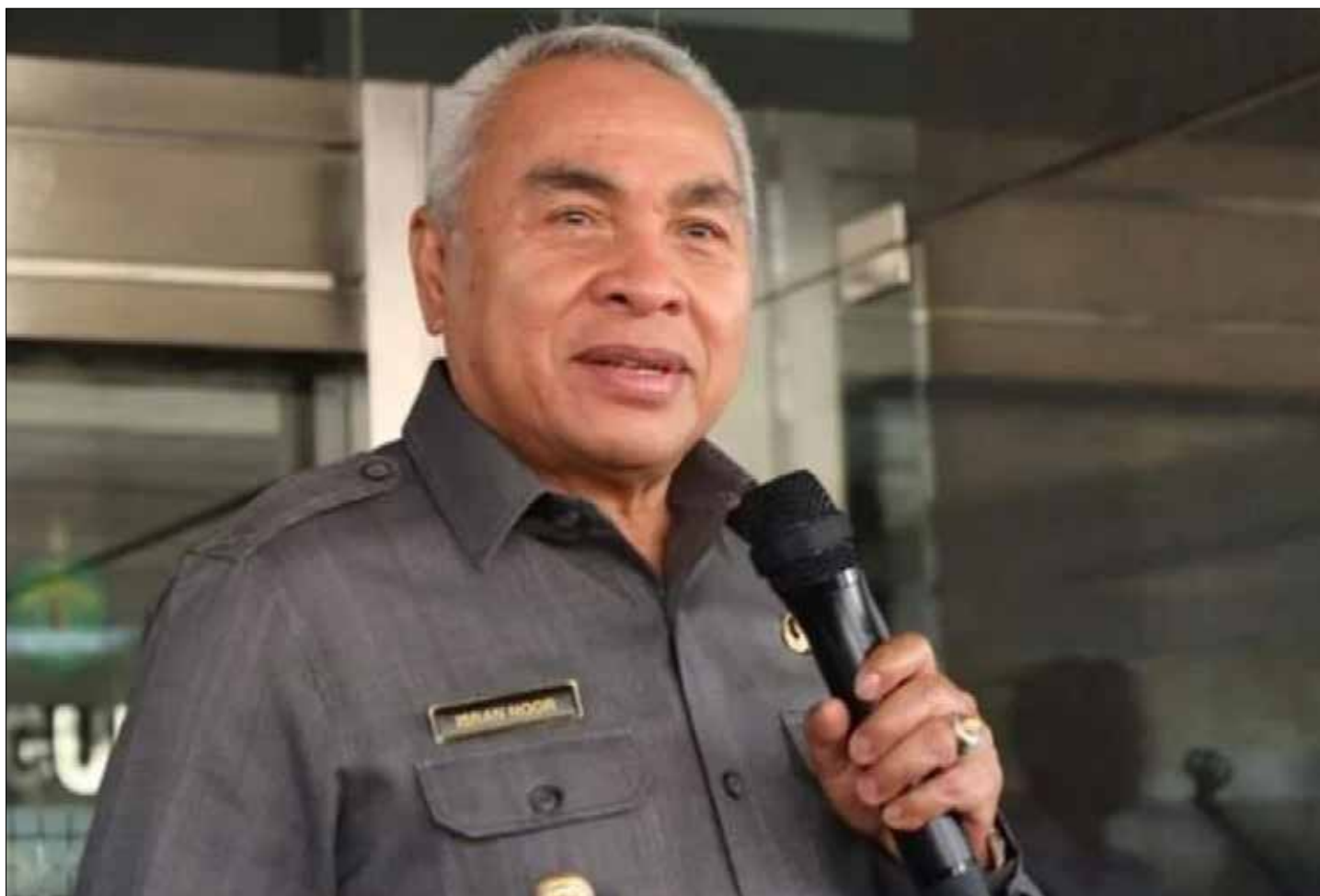
Gubernur Kaltim, Isran Noor