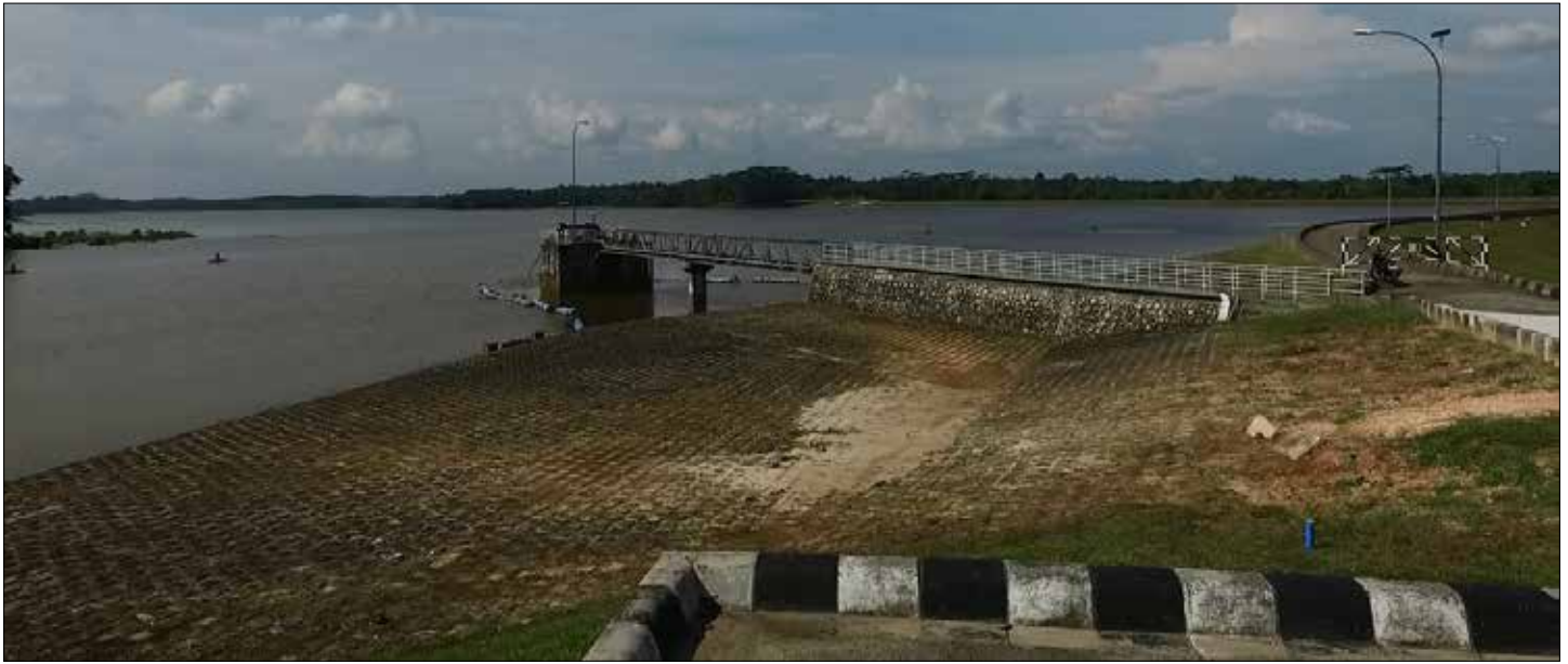
Kondisi Waduk Manggar di Karang Joang menjadi suplai air bersih bagi warga Kota Balikpapan.