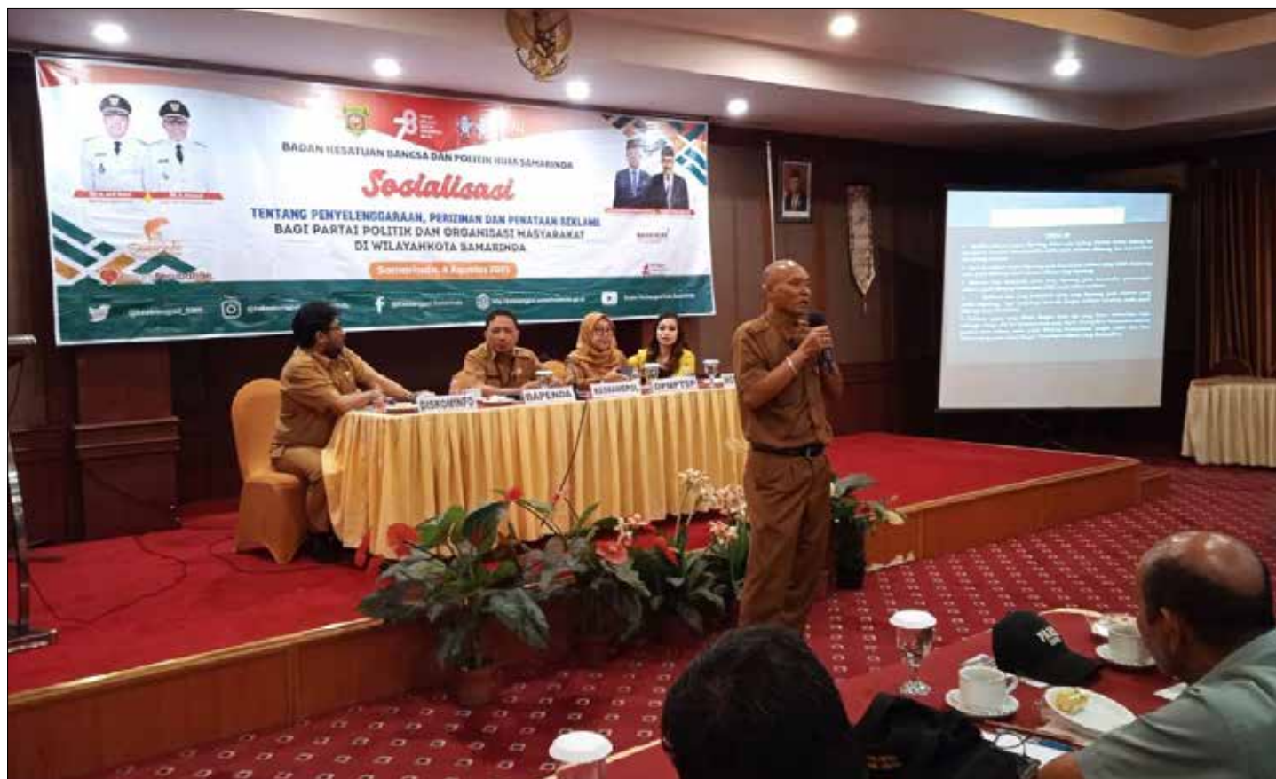
Kesbangpol Samarinda saat melakukan sosialisasi perizinan reklame.