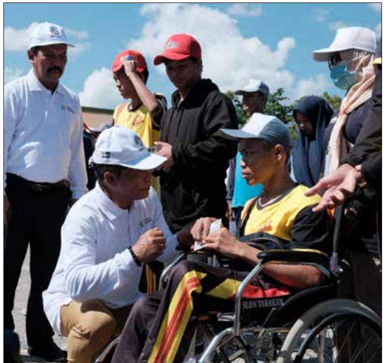
PERHELATAN O2SN: Gubernur Kaltara, Drs H Zainal A Paliwang SH, M.Hum menyambangi salah satu peserta O2SN Tingkat Provinsi Kaltara di Lapangan SMK Negeri 2 Tarakan, Selasa (8/8).

Sementara dalam penyerahan SK BLUD kepada SMK yang ada di Kaltara merupakan tonggak sejarah dalam meningkatkan mutu dan relevansi pendidikan vokasi di provinsi ini. Melalui BLUD SMK, diharapkan para peserta didik dapat mengalami pembelajaran yang lebih kontekstual dengan menghadapi tantangan dunia kerja sebenarnya. "Ini akan menjadi investasi besar untuk mencetak lulusan SMK yang siap bersaing di dunia industri," tutup Gubernur Zainal. (dkisp)