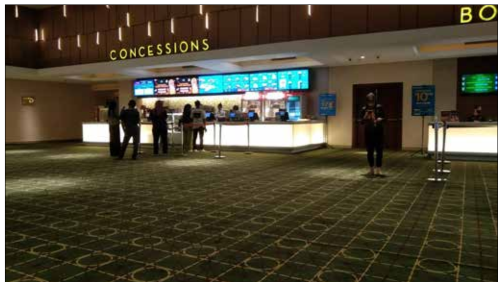
Suasana Bioskop Samarinda Central Plaza.

Meg 2: The Trench memiliki penonton yang tinggi, karena ini merupakan lanjutan peristiwa dari film sebelumnya (The Meg) yang masih menggantung. Rasa penasaran inilah yang menarik penonton untuk