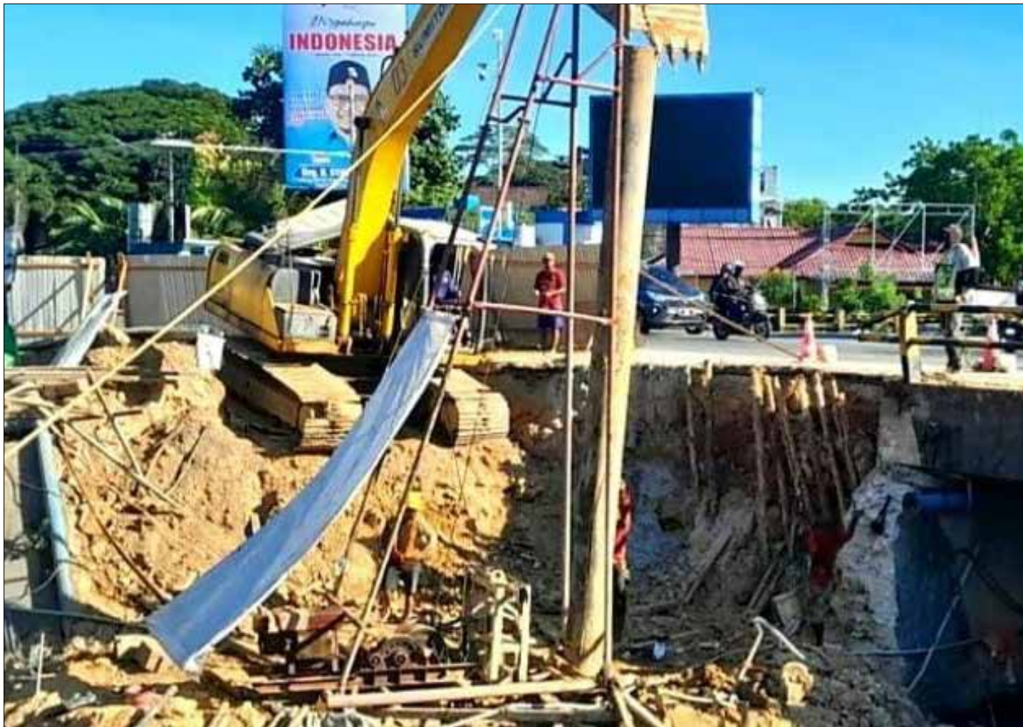
Proses pengerjaan pelebaran selokan di persimpangan BSCC Dome Balikpapan.