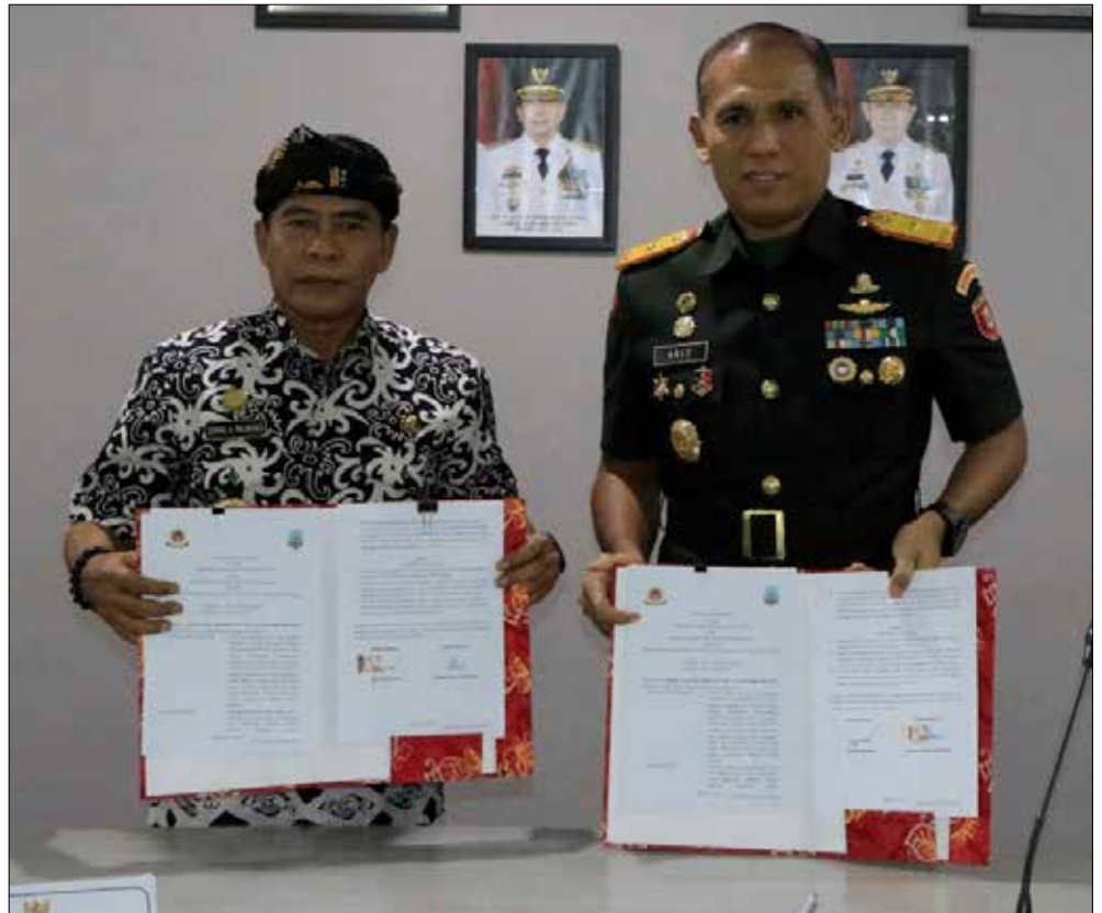
KERJASAMA: Pemprov Kaltara bekerjasama dengan Korem 092/Maharajalila dalam pengerjaan normalisasi Sungai Selor dan Buaya.

Lebih lanjut, mulai pengerjaan normalisasi sungai tersebut akan terbagi menjadi dua. PUPR –Perkim mulai dari Meranti hingga Intake Sungai Buaya, sedangkan Korem dari Kam-