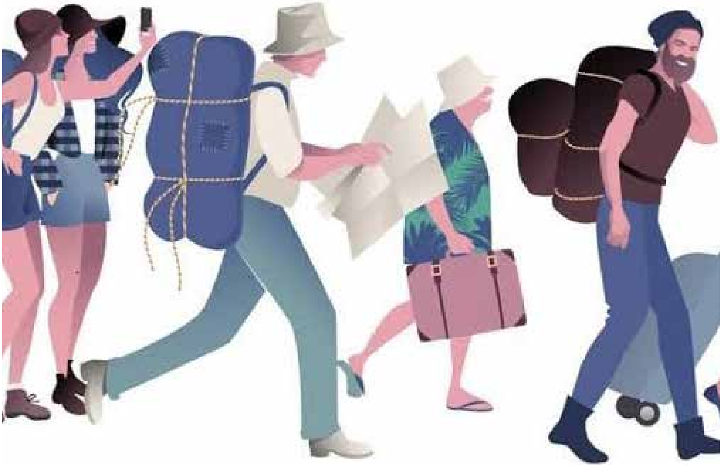
Ilustrasi kunjungan wisatawan mancanegara.