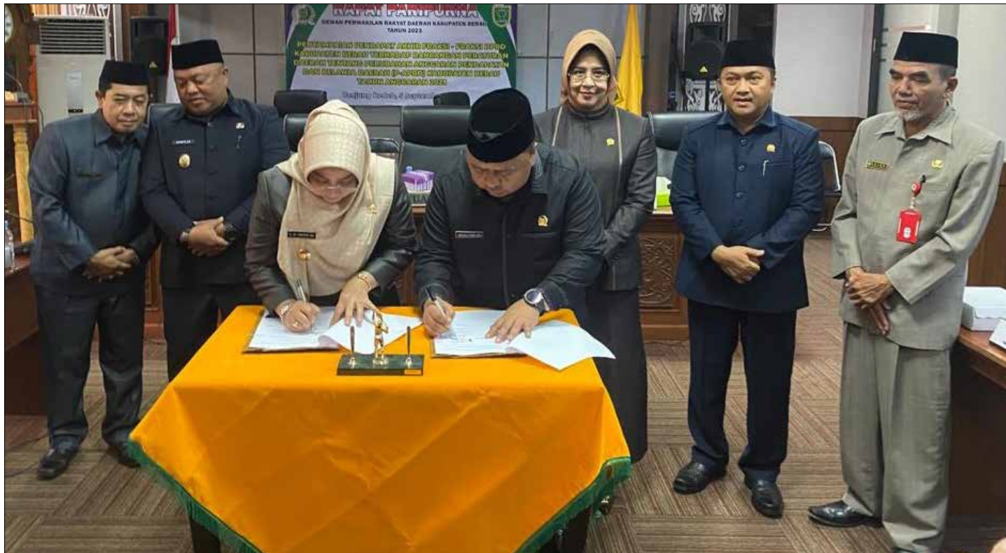
Penandatanganan berita acara persetujuan bersama antara pihak eksekutif dan legislatif.