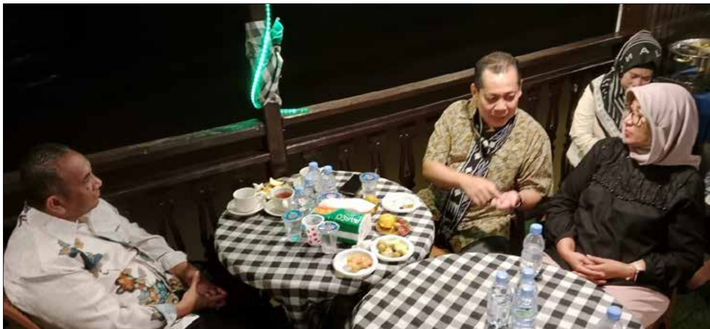
Suasana rapat antara ANRI dan DPK Kaltim di atas kapal Pesut Etam.