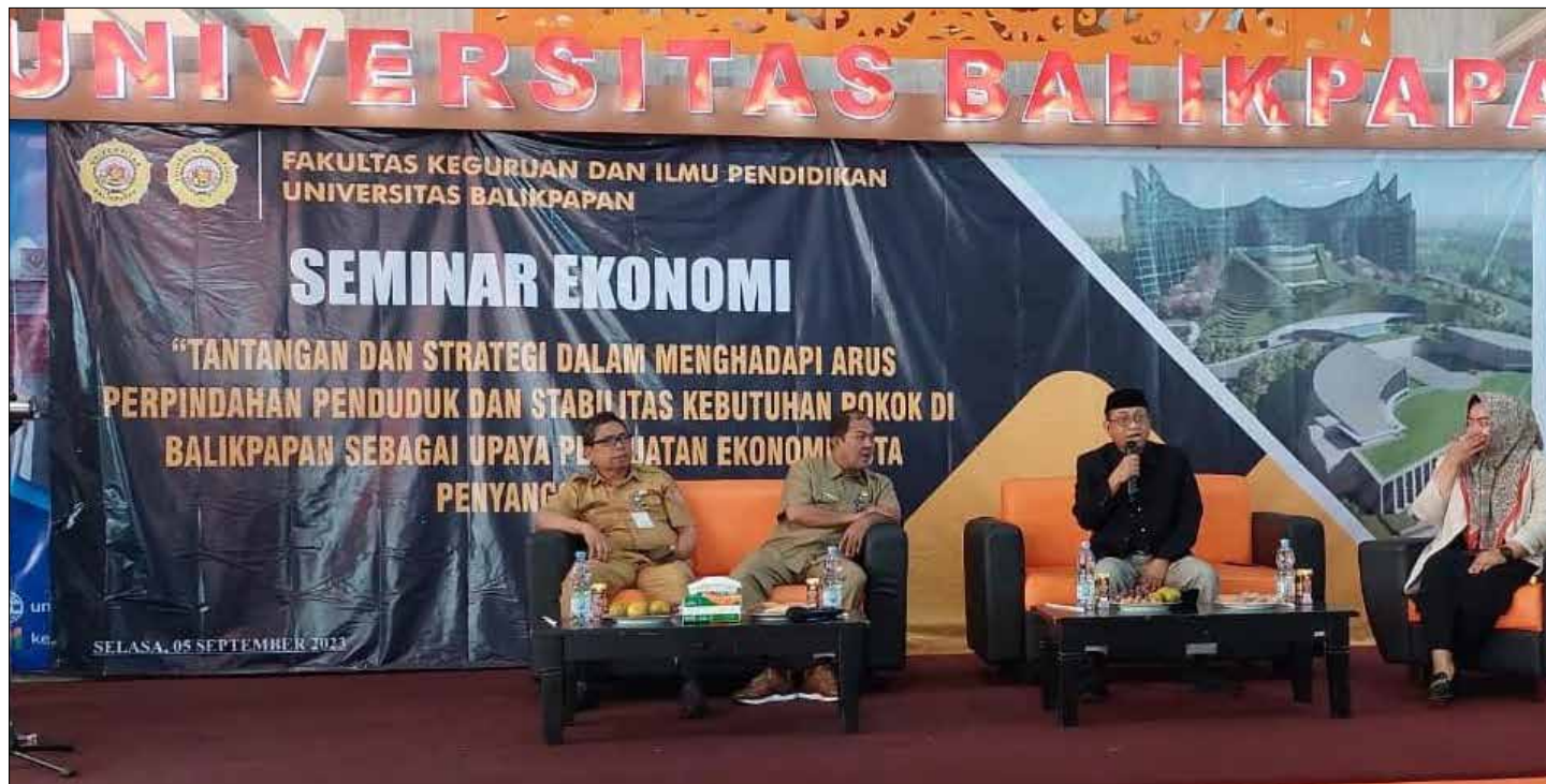
Seminar Ekonomi dengan tema “Tantangan dan Strategi dalam Menghadapi Arus Perpindahan Penduduk dan Stabilitas Kebutuhan Pokok di Balikpapan sebagai upaya penataan ekonomi kota penyangga IKN.