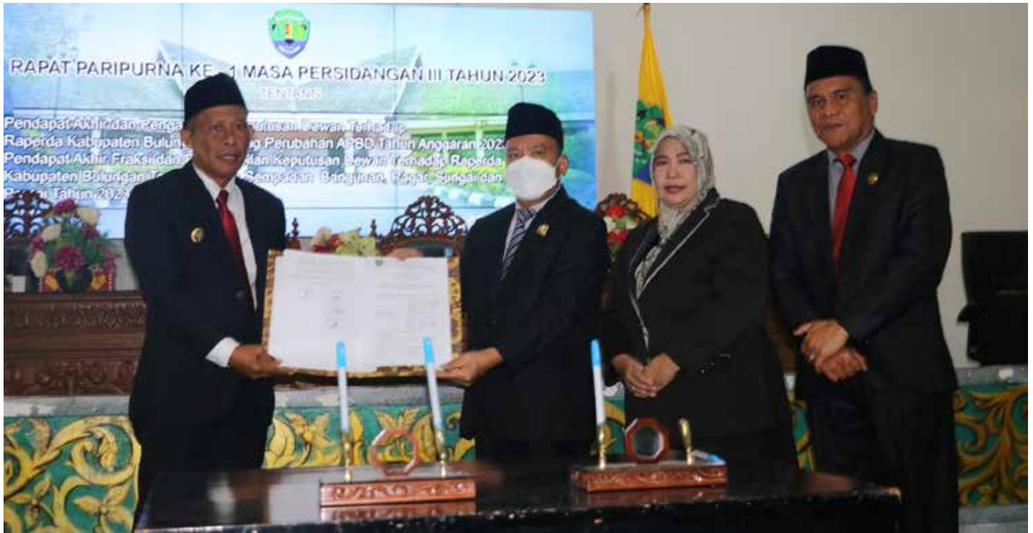
HUMAS DPRD BULUNGAN

PARIPURNA: DPRD Bulungan sepakati dua Ranperda soal perubahan APBD tahun 2023 dan ranperda tentang Garis Sempadan Bangunan (GSP).