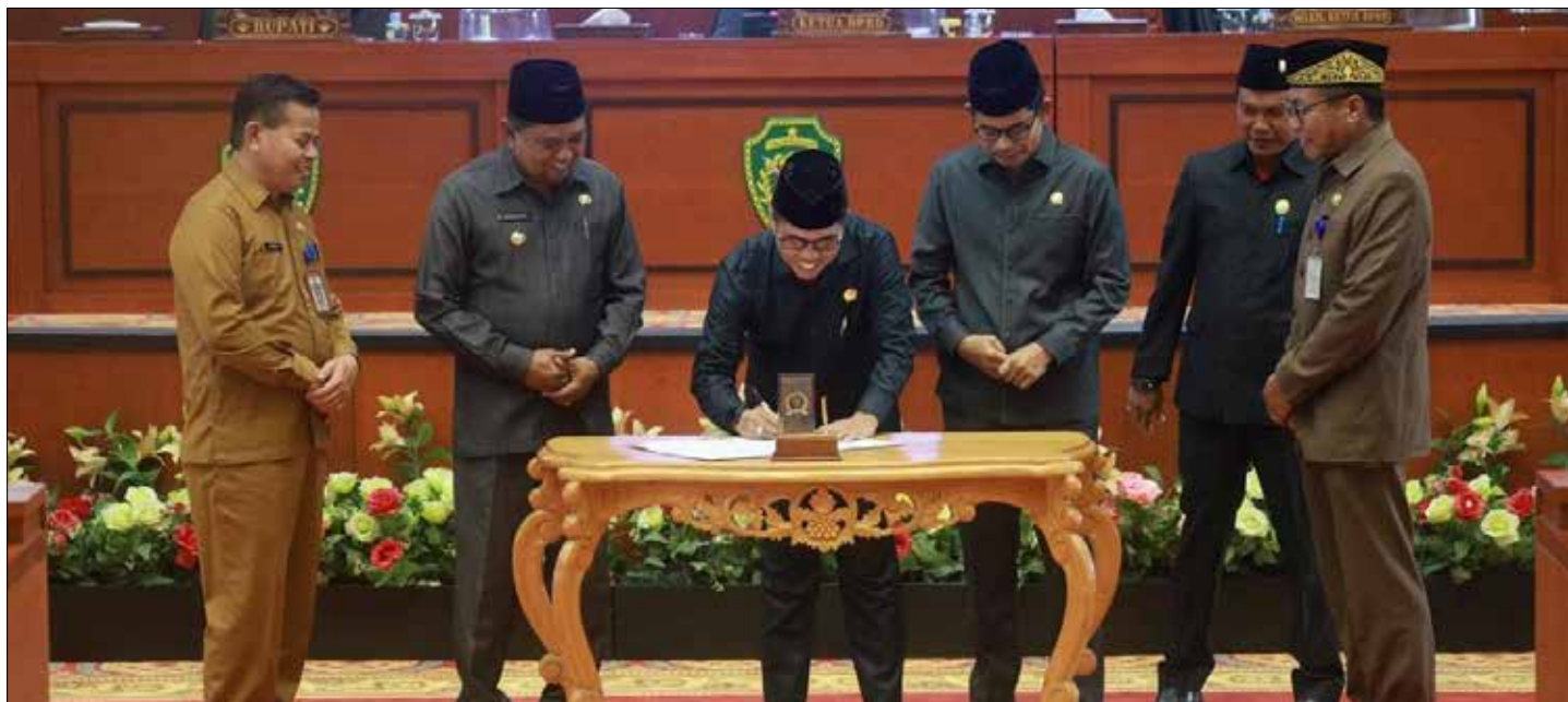
Penandatanganan keputusan DPRD PPU serta berita acara pengumuman usul pemberhentian kepala daerah PPU sisa masa jabatan 2018-2023, Selasa (5/9/2023).