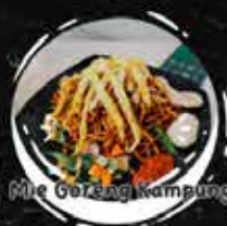
Mie Goreng Kampung