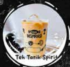
Teh Tarik Spirit