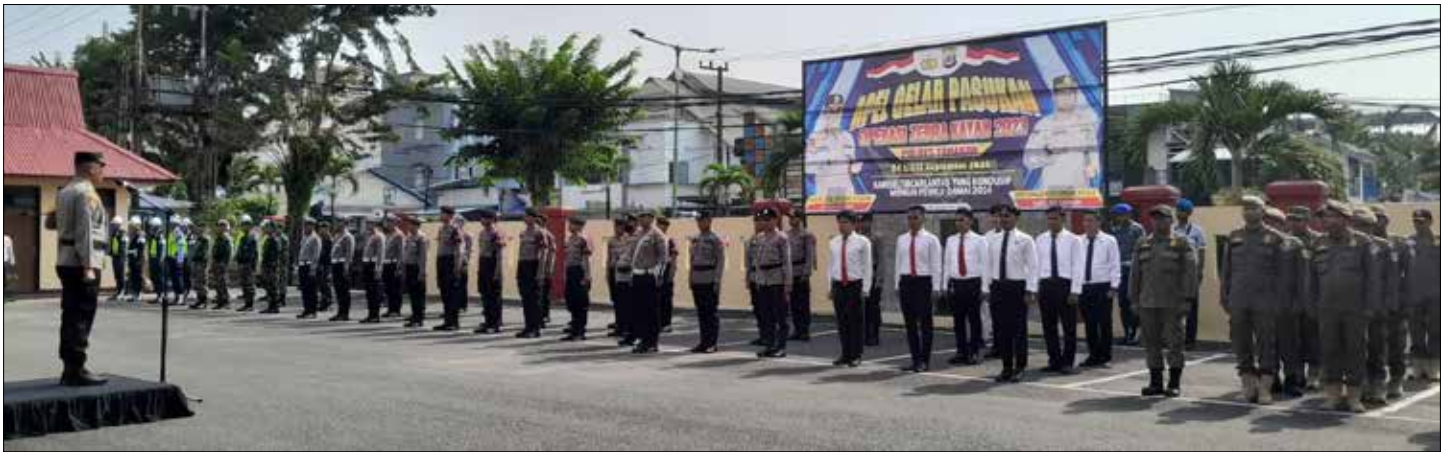
Apel Gelar Pasukan Operasi Zebra Kayan 2023 di Mapolres Tarakan.