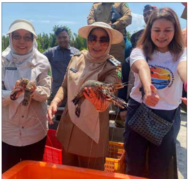
Budidaya udang ramah lingkungan di ekosistem mangrove Kampung Pegat Batumbuk Kecamatan Pulau Derawan.