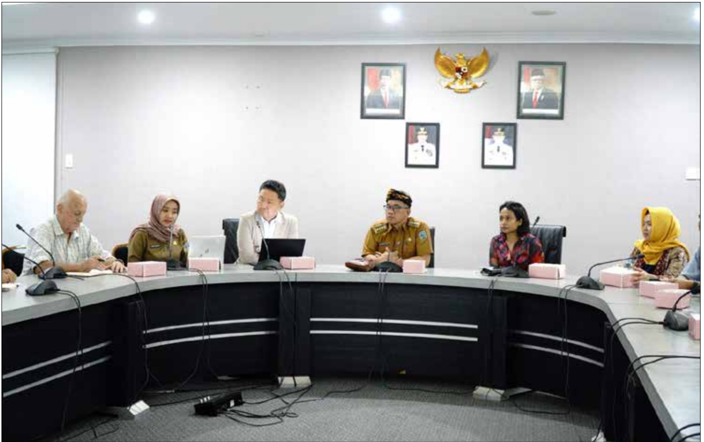
EKONOMI HIJAU: Bappeda-Litbang Kaltara menerima kunjungan kehormatan GGGI di Ruang Rapat Lantai 1 Kantor Gubernur Kaltara, Senin (4/9).