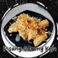
Pisang Goreng Kaya