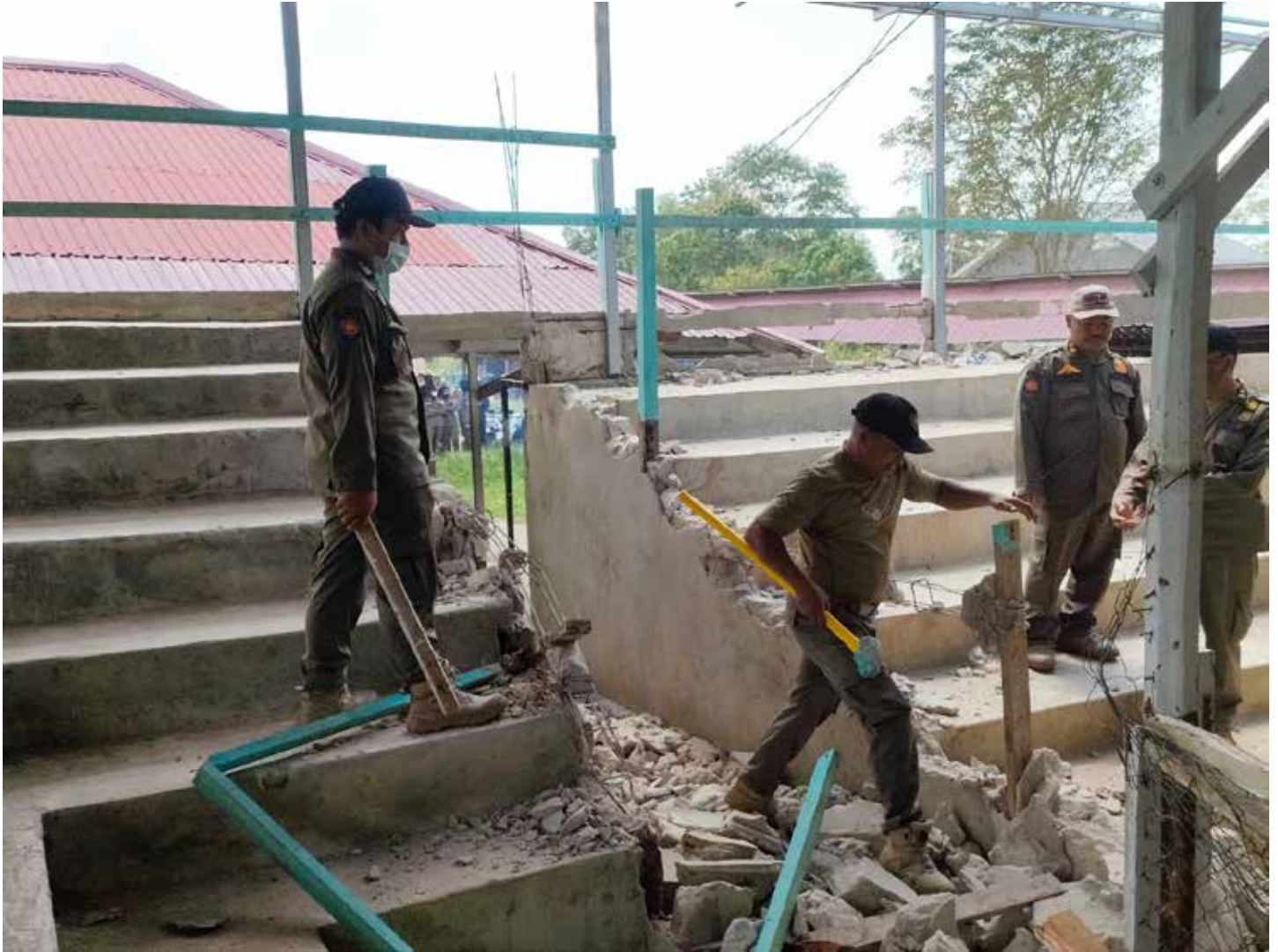
Pembongkaran arena judi sabung ayam di kawasan Manggar Sari, Balikpapan Timur oleh Satpol PP Kota Balikpapan.