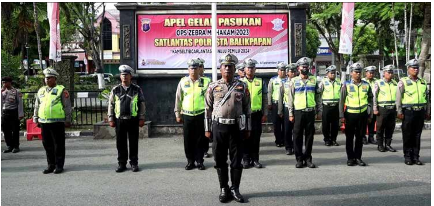
Apel gelar pasukan kesiapan personel Polresta Balikpapan dalam Operasi Zebra Mahakam 2023 di Makopolresta Balikpapan.