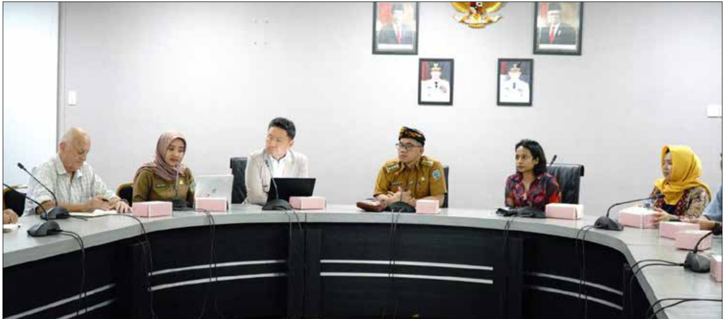
EKONOMI HIJAU: Bappeda-Litbang Kaltara menerima kunjungan kehormatan GGGI di Ruang Rapat Lantai 1 Kantor Gubernur Kaltara, Senin (4/9).