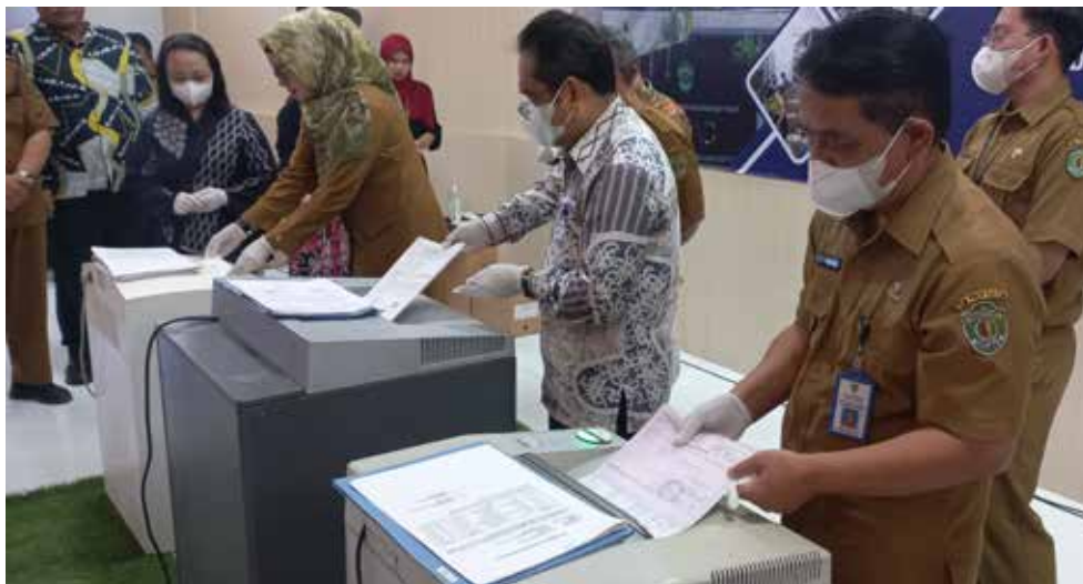
Pemusnahan arsip menggunakan mesin pencacah arsip.