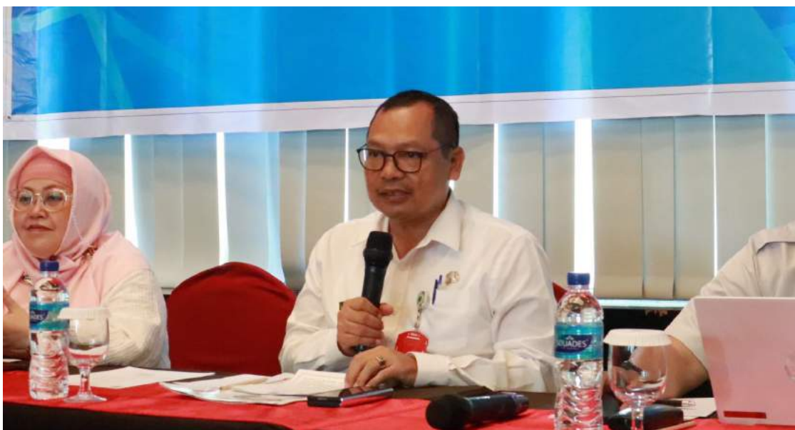
Kepala Dinkes Kaltim memaparkan evaluasi APBD. (Istimewa)