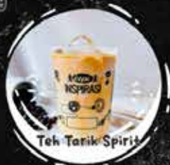
Teh Tarik Spirit