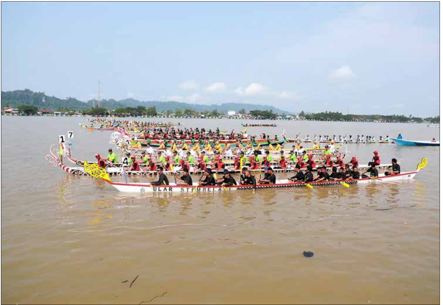
Puluhan perahu dayung, menghiasi sungai Kayan Tanjung Selor.