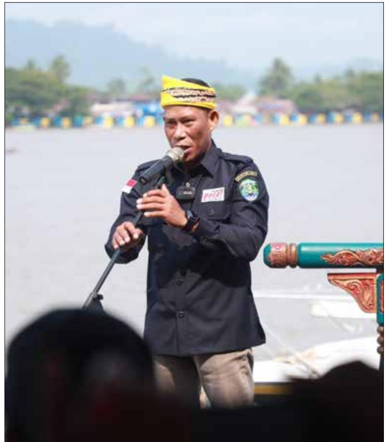
Bupati Bulungan, Syarwani ajak masyarakat, kurangi aktivitas diluar rumah.