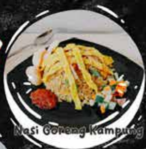
Nasi Goreng Kampung