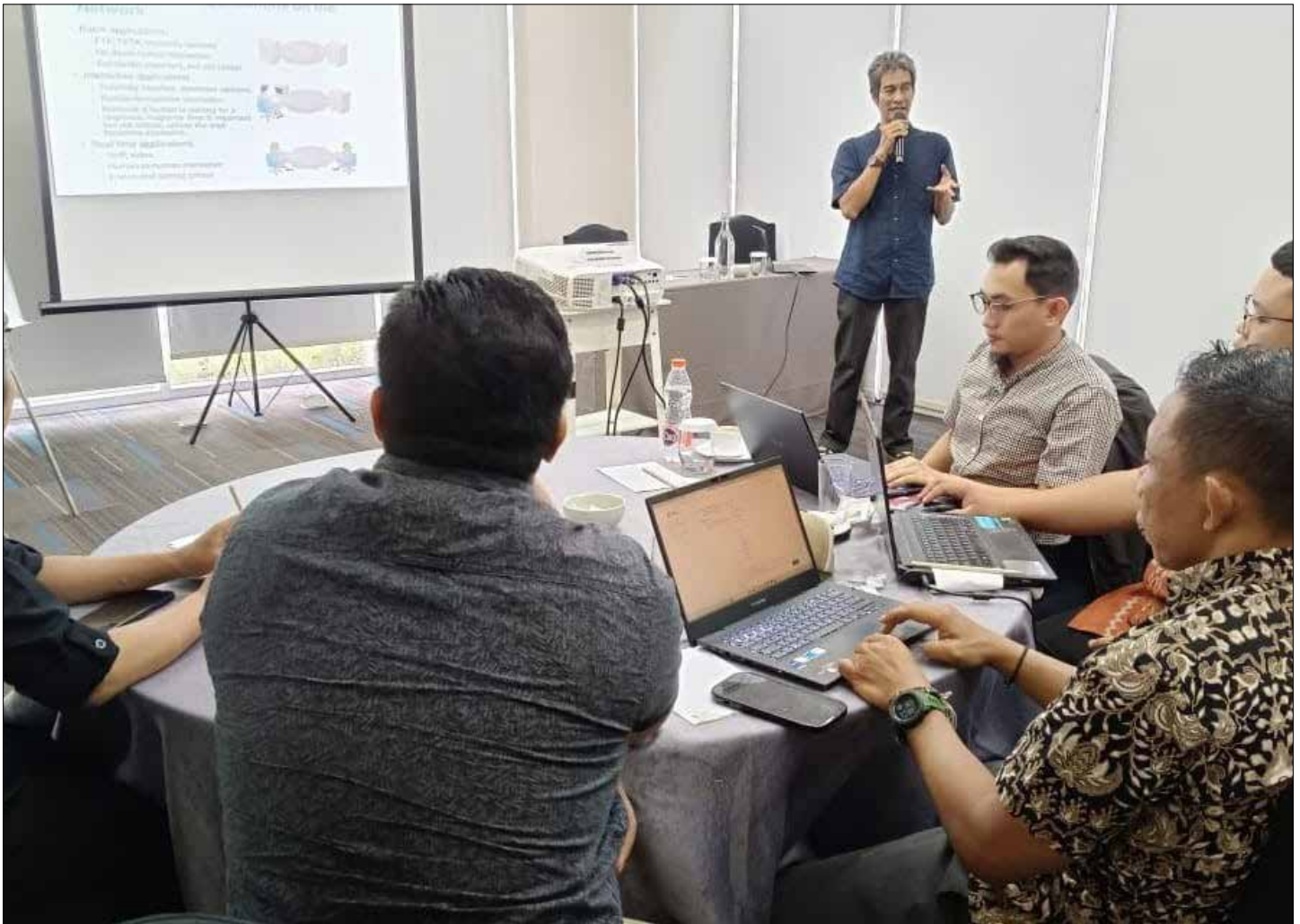
Rangkaian pelatihan teknis tim Aptika Diskominfo Kukar di Jakarta.