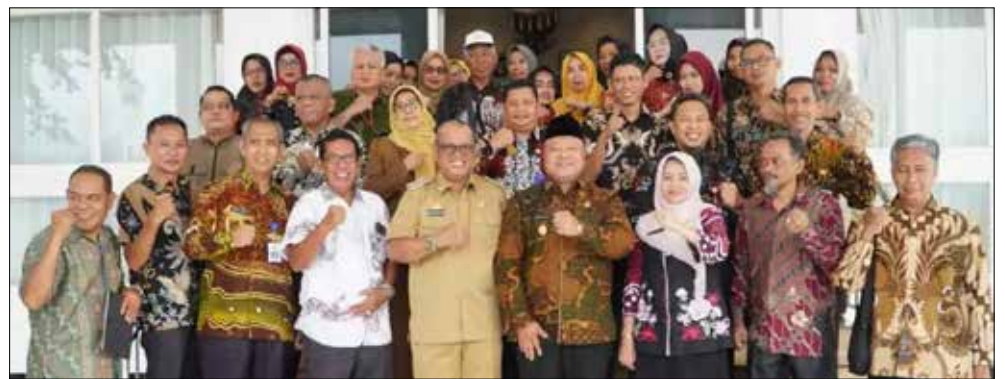
Rombongan Pemerintah Kabupaten Berau saat melakukan kunjungan kerja ke Kabupaten Soppeng.

Dalam kesempatan itu ia juga menyampaikan bahwa masih banyak sektor potensial yang belum tergarap dengan optimal. Seperti sektor pertanian yang harus dikem-