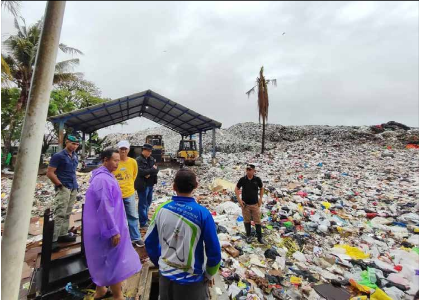
Tampak tumpukan sampah yang berada di TPA Aki Babu.