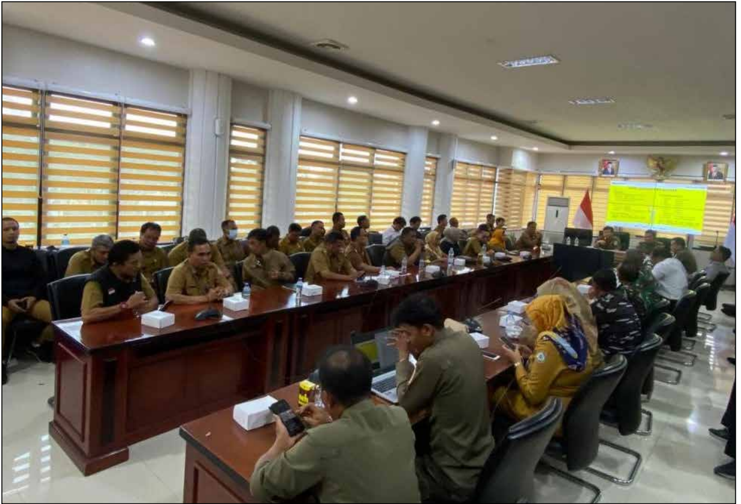
Rapat Satpol PP Kota Balikpapan untuk menertibkan Pom Mini di jalan utama Kota Balikpapan.