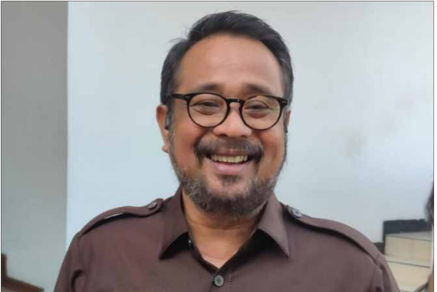
Wakil Ketua DPRD Kota Balikpapan, Sabaruddin Panrecalle