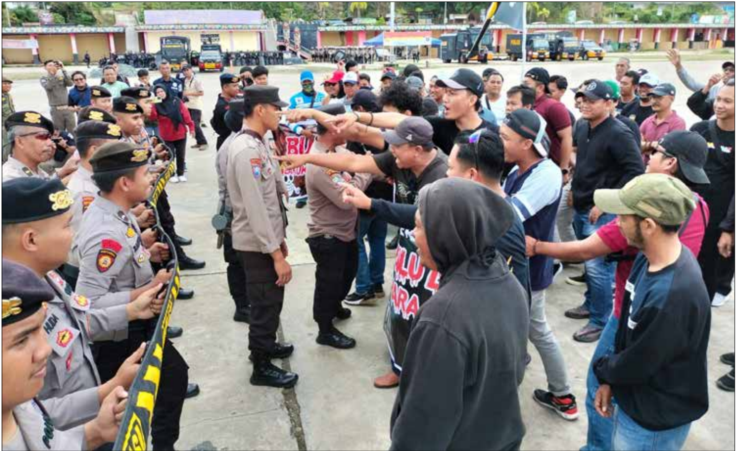
Simulasi unjuk rasa oleh personel gabungan terhadap tahapan Pemilu.