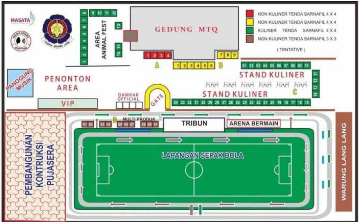
Ilustrasi maket stand Animal Fest Disdamkartan tahun lalu.