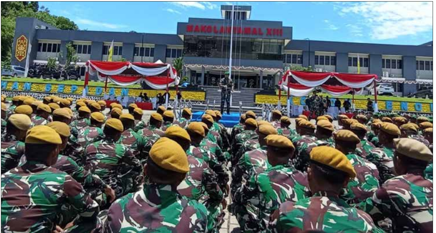
Upacara Penyambutan dan Pelepasan Satgas Pamtas di Lapangan Apel Mako Lantamal XIII, pada Selasa (19/9/2023).