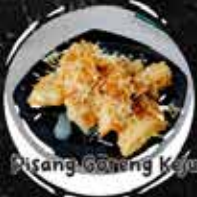
Pisang Goreng Kaya