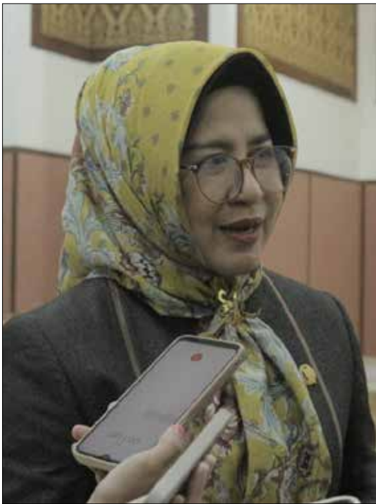
Wakil Ketua I DPRD Berau, Syarifatul Syadiyah

TANJUNG REDEB – Pasar Sanggam Adji Dilayas (PSAD) yang berada di Kelurahan Rinding, Kecamatan Teluk Bayur dibangun pada 2009 lalu dan pernah dinobatkan sebagai pasar tradisional terbaik di Indonesia, kini kondisi pasar tersebut justru membuat publik prihatin.