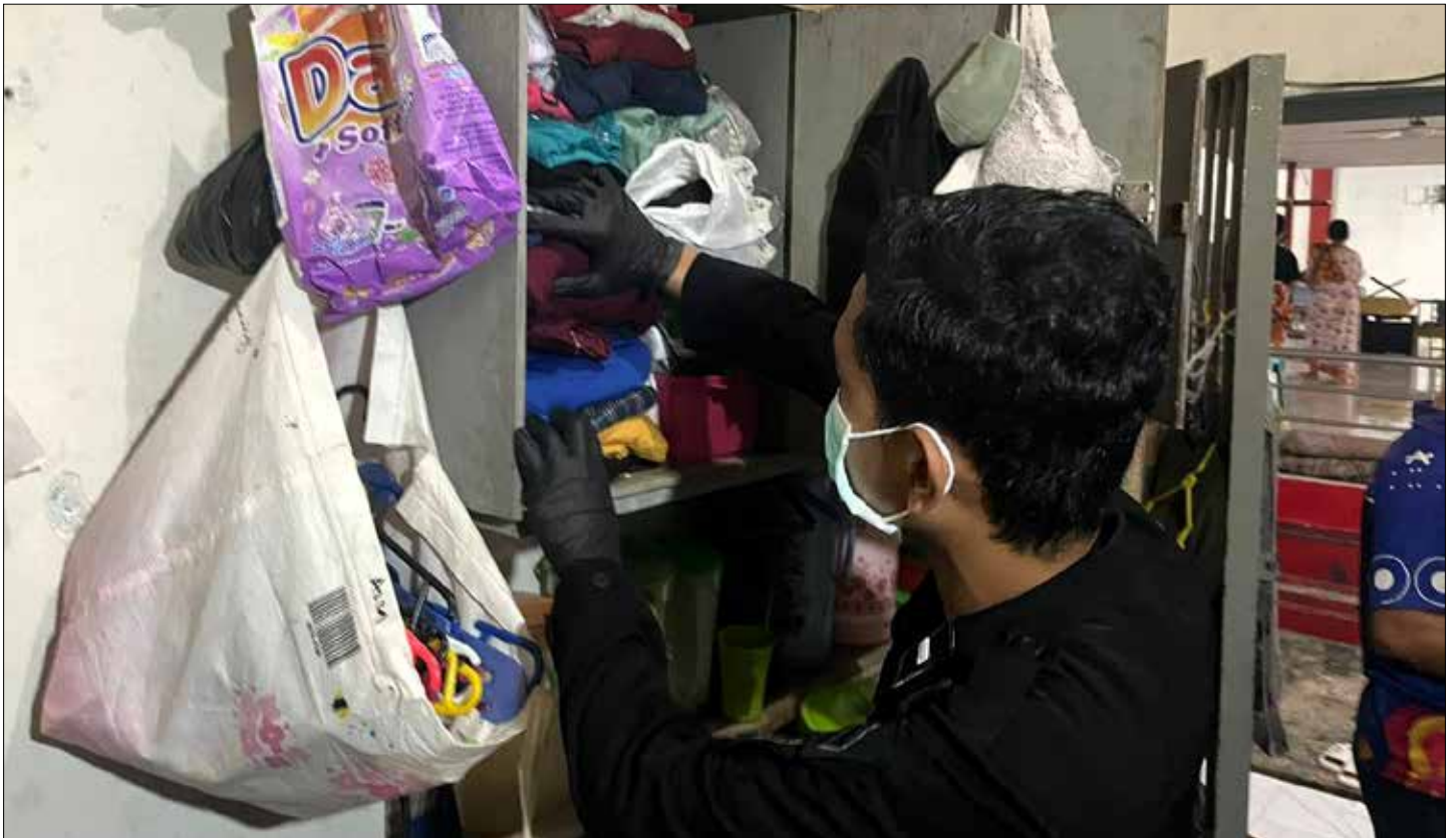
Petugas Lapas Kelas IIA Tarakan saat melakukan razia kamar WBP.