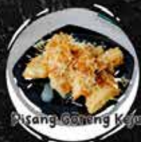
Pisang Goreng Kaya