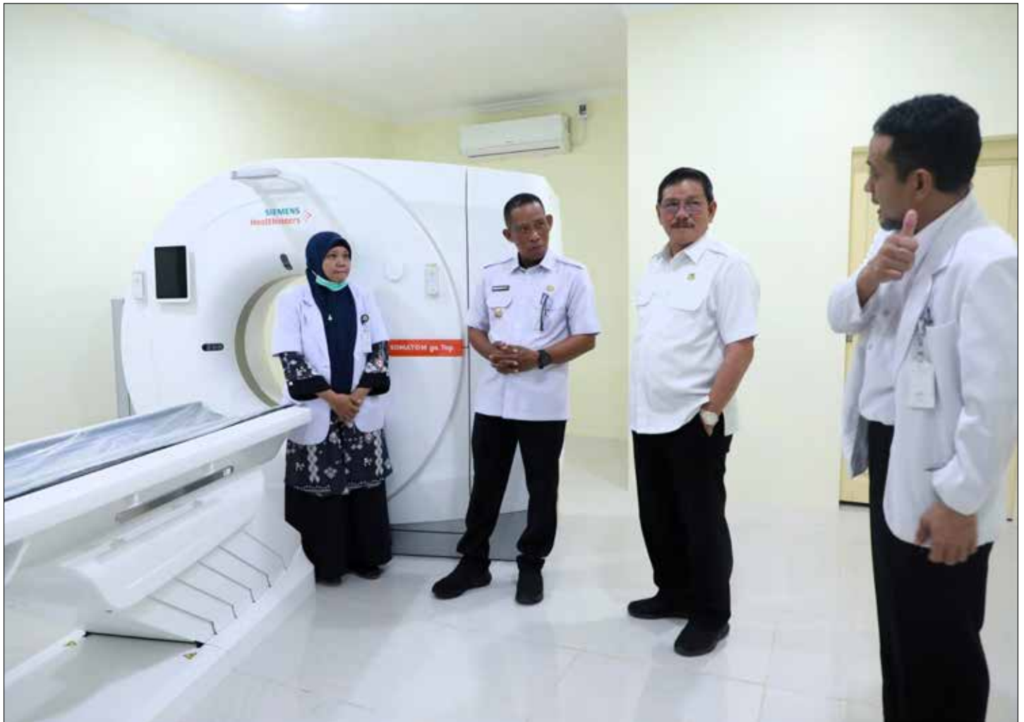
Beberapa alat medis yang baru didatangkan ke RSD dr Soemarno Sosroatmodjo Tanjung Selor.