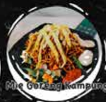
Mie Goreng Kampung