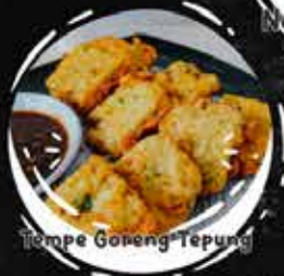
Tempe Goreng Tepung