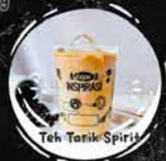
Teh Tarik Spirit