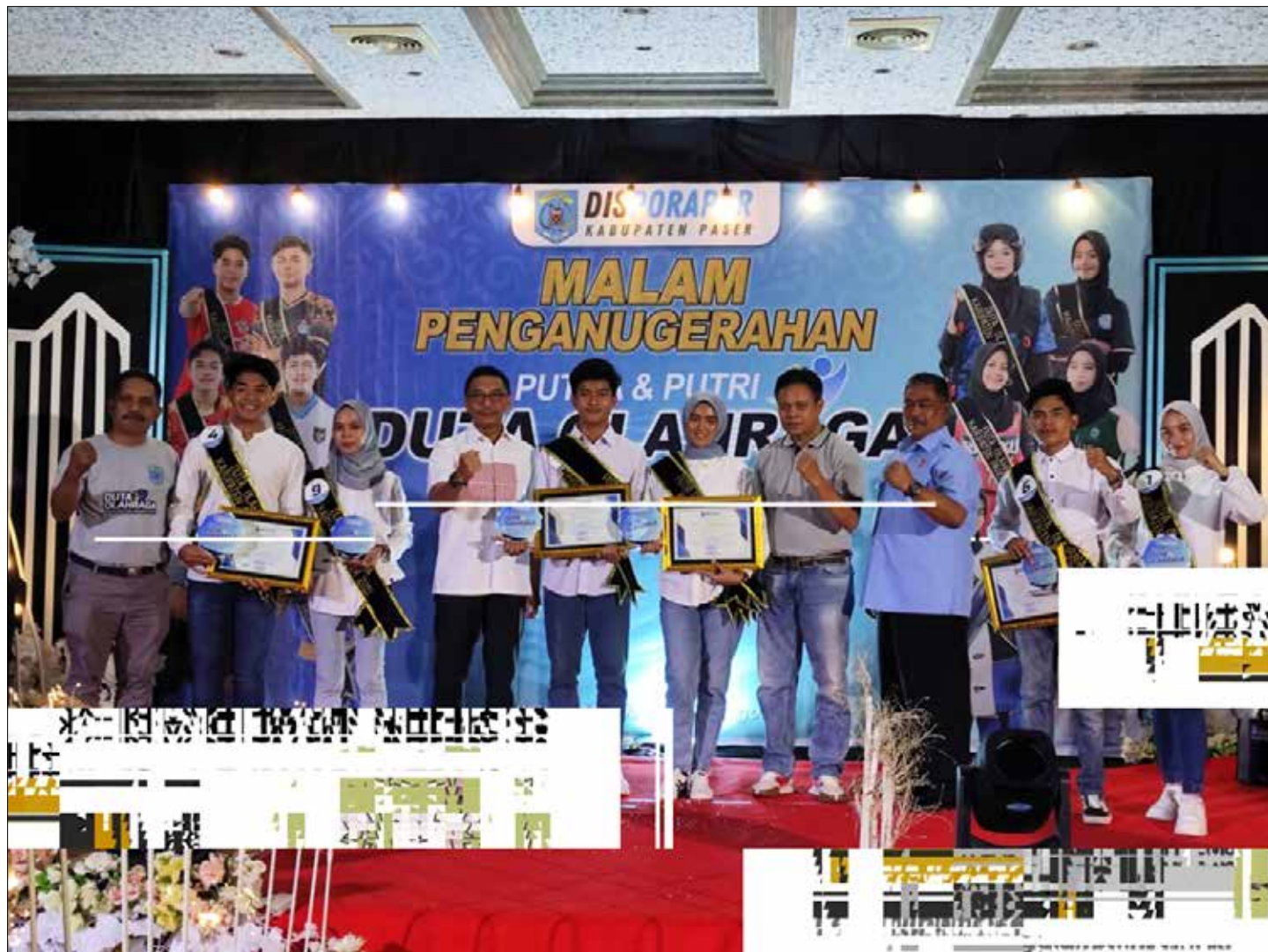
Para finalis Duta Olahraga Kabupaten Paser 2023.