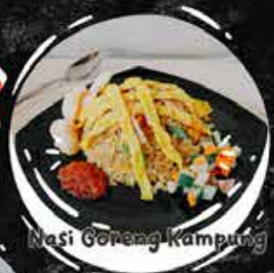
Nasi Goreng Kampung