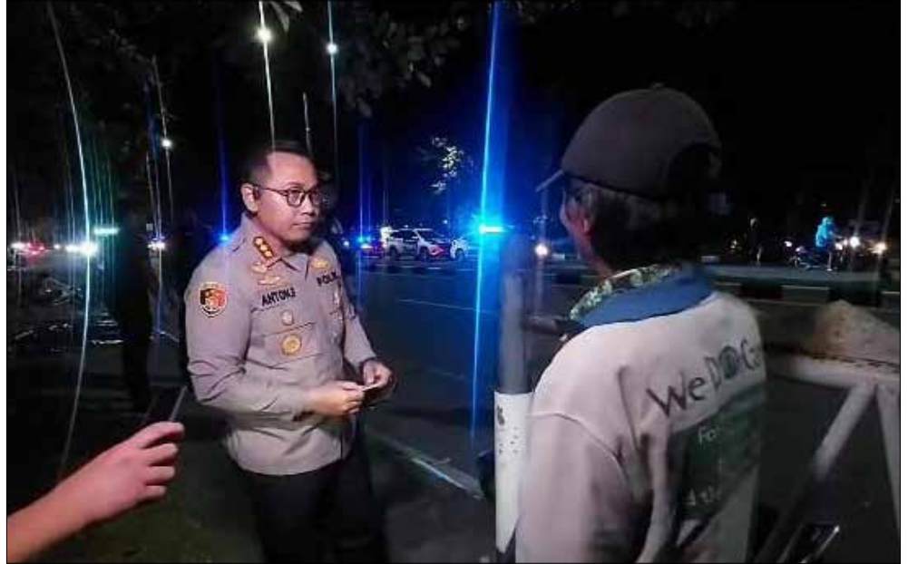
Kapolresta Balikpapan, Kombes Pol Anton Firmanto saat memimpin Blue Light Patrol di kawasan Melawai.

Lebih lanjut Kapolresta Balikpapan menjelaskan, Blue Light Patrol ini akan gencar dan rutin dilaksanakan oleh jajarannya, baik secara mobile maupun stasioner, dan diharapkan dari kegiatan rutin ini menjadi langkah-langkah preventif dan bentuk inovasi beraksi yang terus digalakkan guna memberikan pelayanan prima kepada masyarakat dan menuju Polri yang presisi.