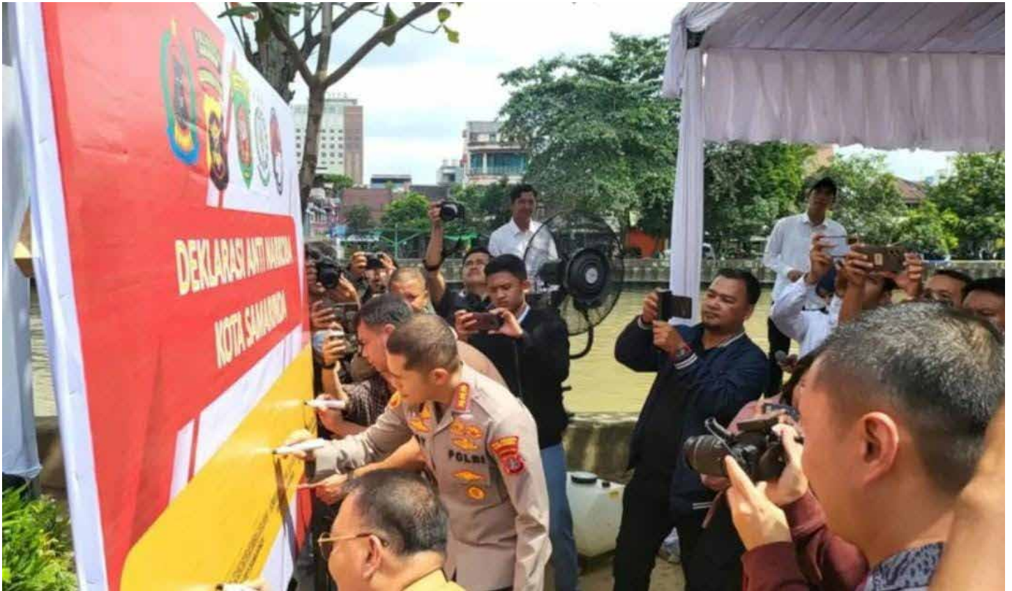
Peresmian Sungai Dama sebagai Kampung Bebas Narkoba.