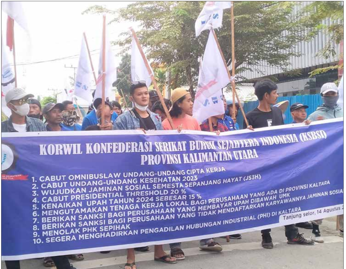
AKSI DAMAI: Puluhan pekerja yang tergabung dalam KSBSI Kaltara gelar Aksi Damai dengan menyodorkan 10 tuntutan.