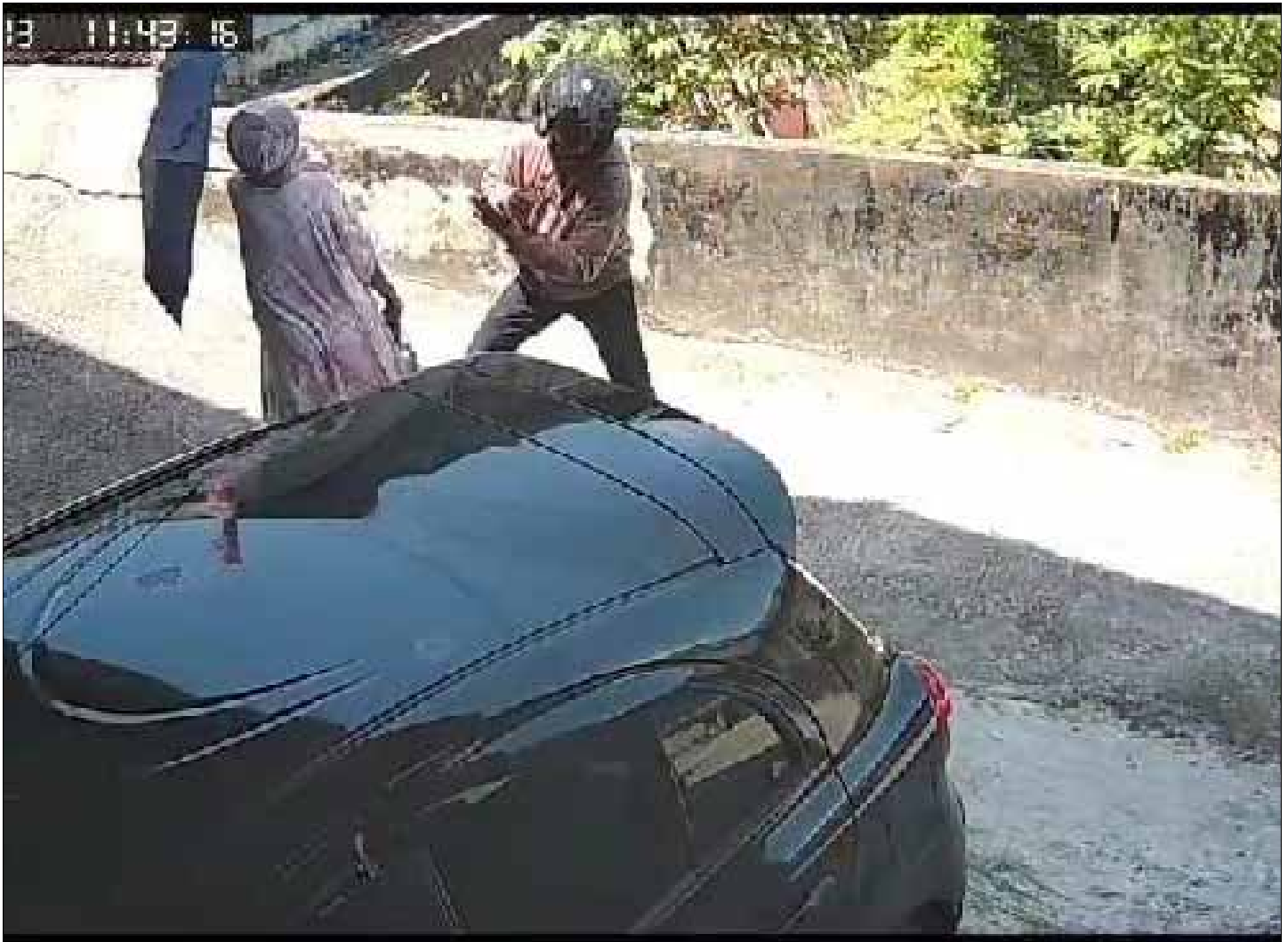
Tangkapan layar aksi jambret di Gang Jambu, RT 6, Kelurahan Telagasari, Balikpapan Kota pada Minggu (13/8) siang.