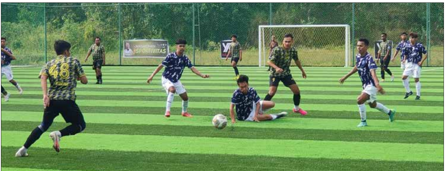
Suasana pertandingan Open Tournament Mini Soccer Media Kaltim Cup 2023.

Mereka saling bersaing untuk memperebutkan hadiah total yang mencapai belasan juta rupiah. “Kami juga telah menyiapkan hadiah untuk pemain terbaik, kiper terbaik, dan pencetak gol terbanyak,” tambah Adhi. (afi)