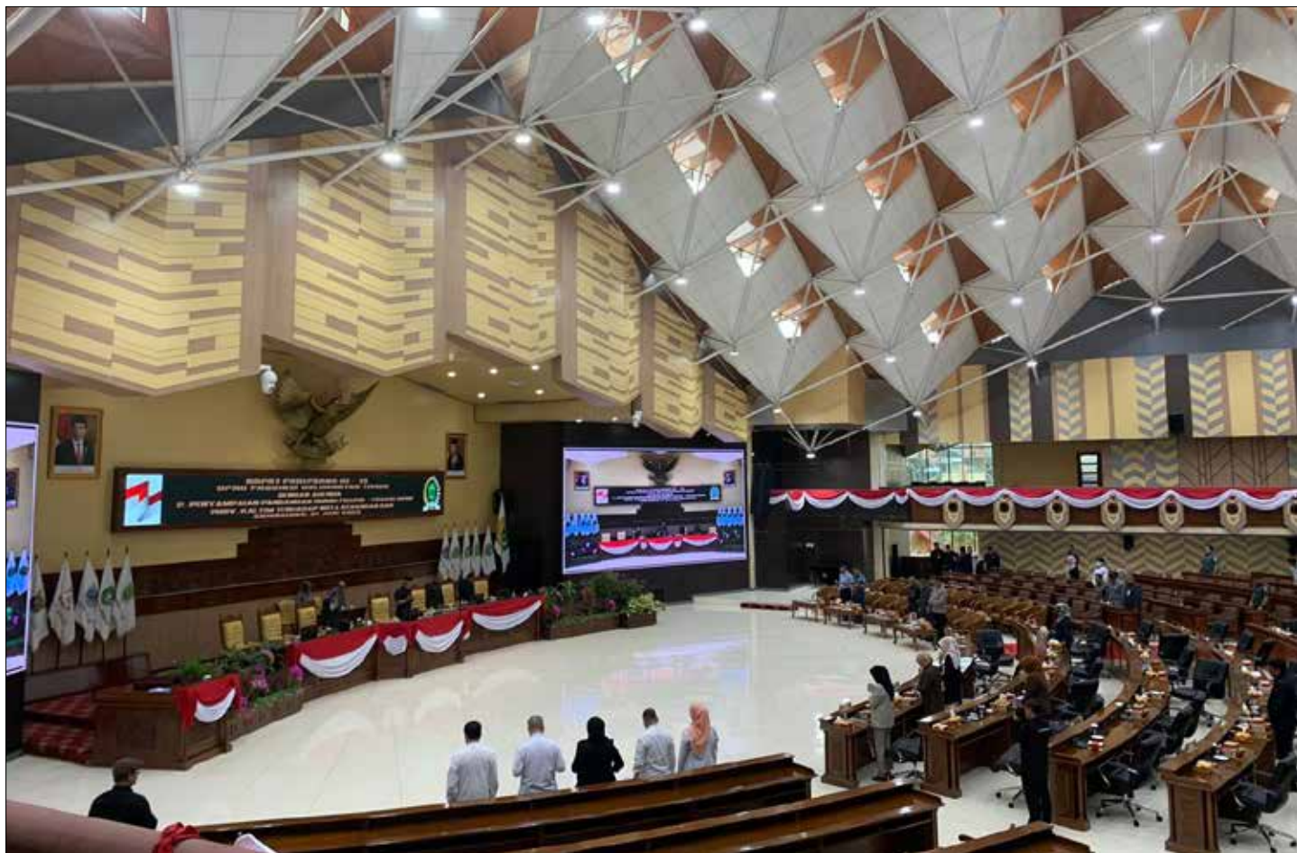
Pelaksanaan Rapat Paripurna ke-24 DPRD, Jumat (11/8/2023).