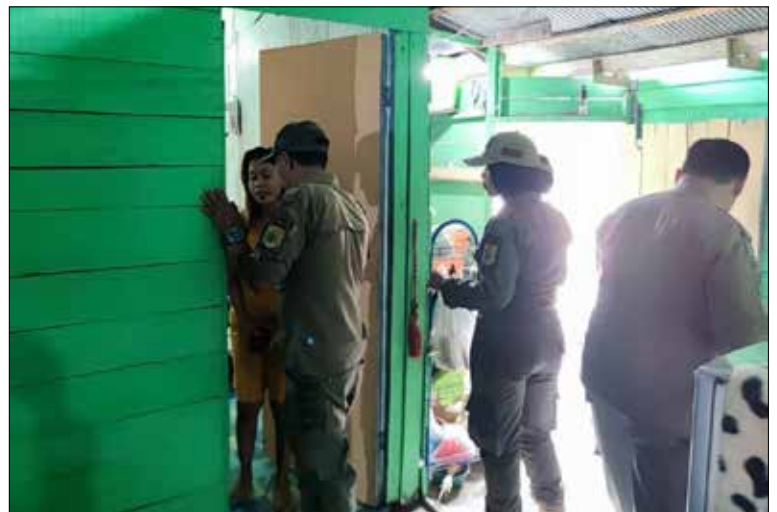
Petugas saat memeriksa salah seorang PSK yang terjaring.

Pewartu : Bhakti Sihombing, Editor : Nicha Ratnasari