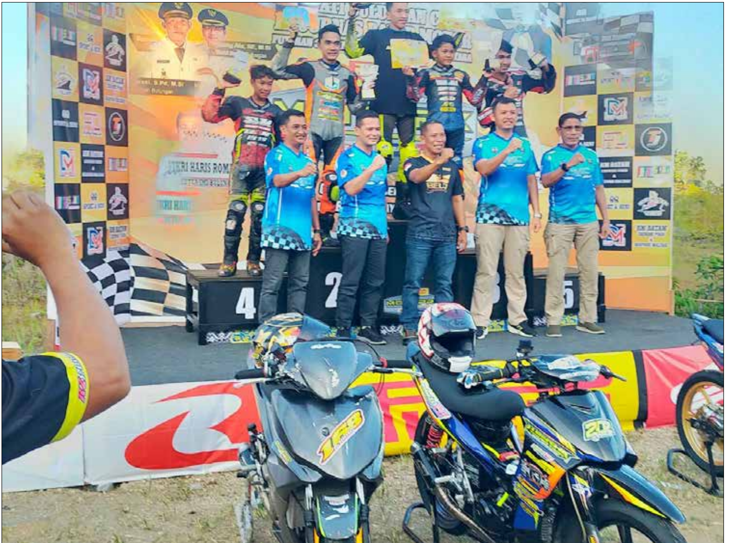
Peserta Balap motor saat menerima hadiah.