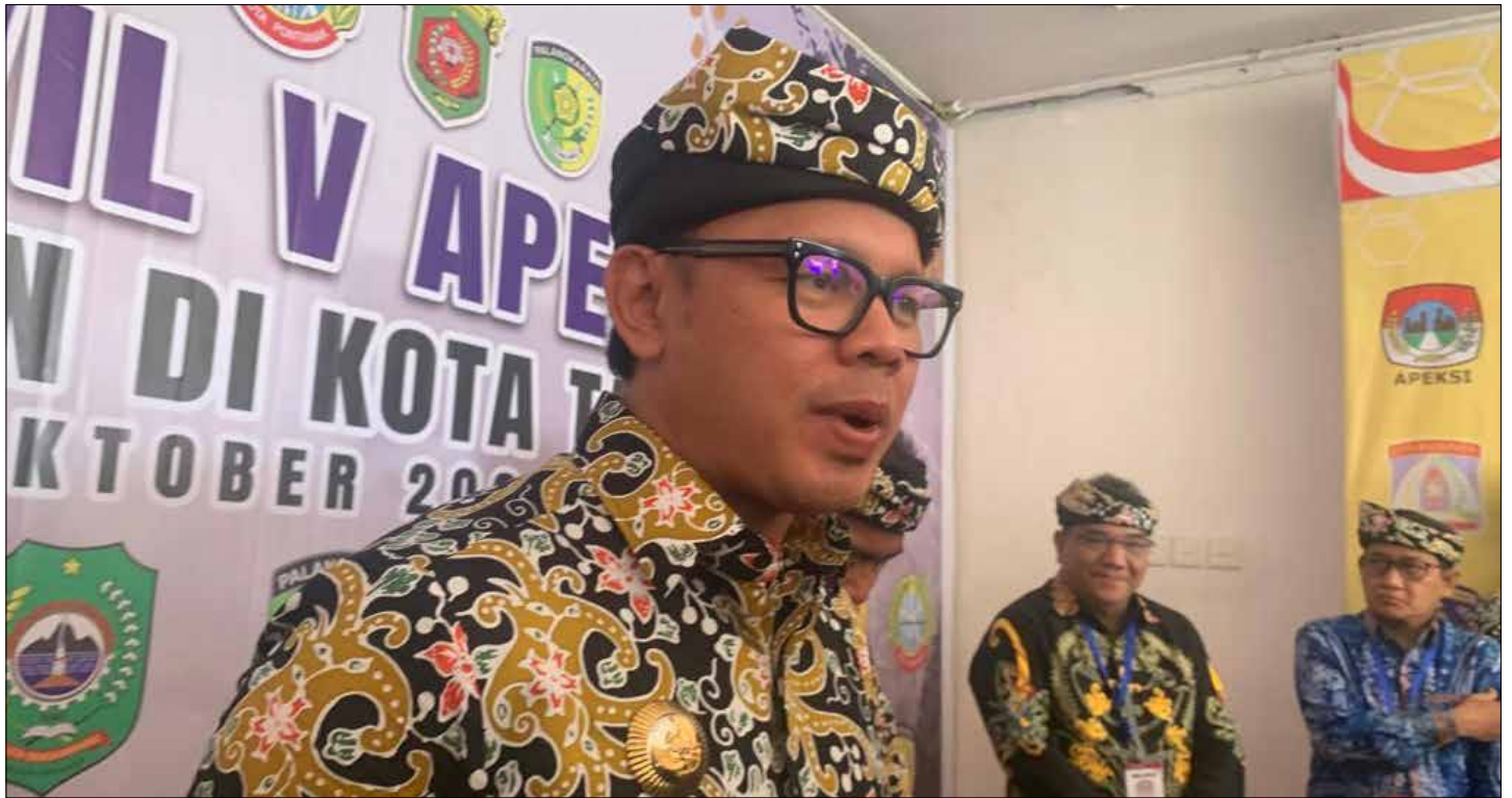
Ketua Dewan Pengurus APEKSI, Bima Arya Sugiarto.