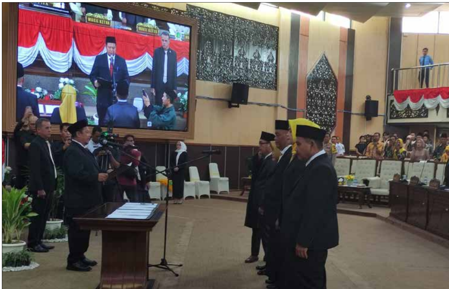
Suasana PAW 5 anggota DPRD Kukar.